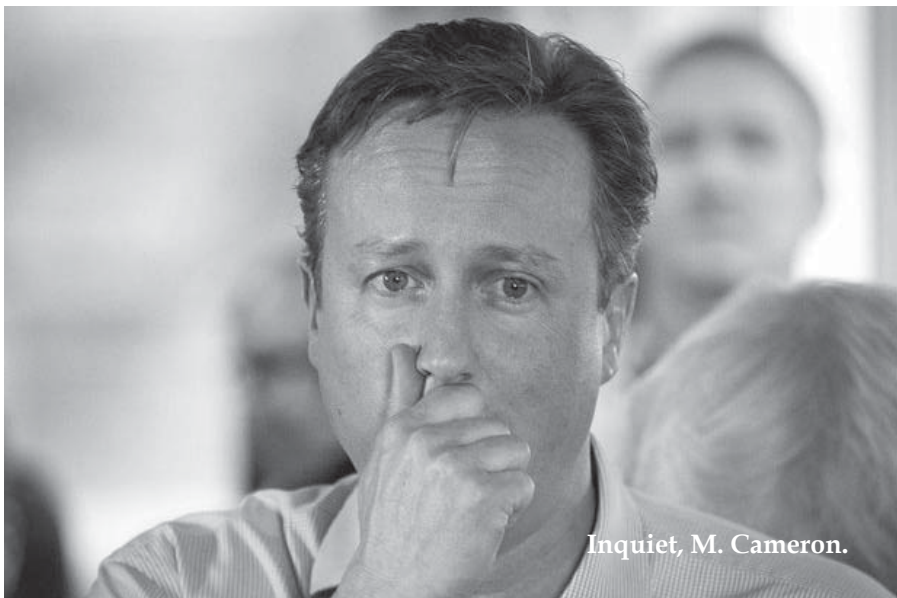
Inquiet, M. Cameron.

L es révélations sur le scandale planétaire d'évasion fiscale (affaire dite des « Panama papers ») sont à analyser selon deux niveaux : 1/ la confirmation de l'état de pourrissement dans lequel est entré le capitalisme au stade impérialiste ; 2/ la récupération idéologique et politique de ces révélations pour freiner la mise en accusation du système capitaliste lui-même.