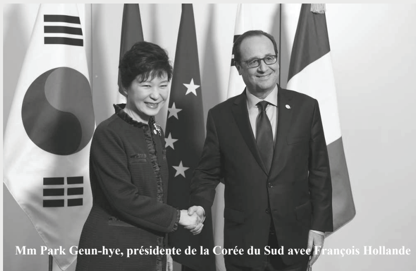
Mme Park Geun-hye, présidente de la Corée du Sud avec François Hollande