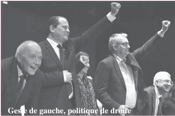
Geste de gauche, politique de droite

pour un choc des ambitions détournant le débat public des véritables enjeux politiques.