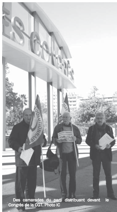
Des camarades du parti distribuant devant le Congrès de la CGT.