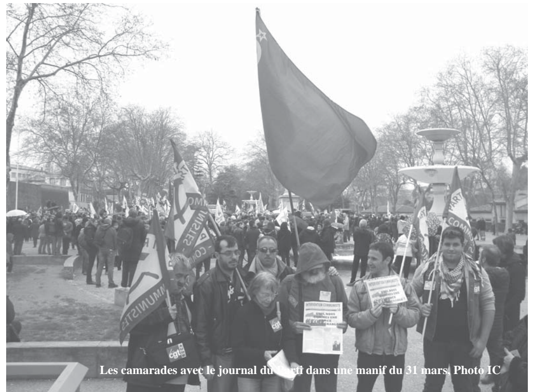
Les camarades avec le journal du parti dans une manif du 31 mars.

Notre Parti appelle les syndiqués et les travailleurs à reconstruire la CGT en bas, dans les entreprises en forgeant patiemment l'outil revendicatif au quotidien, en dénonçant les conditions de travail, les pressions sur les salaires par l'augmentation du temps de travail et des cadences, les violations des libertés et du droit syndical, en exigeant le retrait du projet de loi-Travail et de lutter contre ses effets, et, enfin, renouer avec nos traditions internationalistes dénonçant les